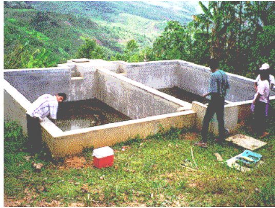
Filtro lento de arena en una zona rural

Básicamente, un filtro lento consta de una caja o tanque que contiene una capa sobrenadante del agua que se va a desinfectar, un lecho filtrante de arena, drenajes y un juego de dispositivos de regulación y control.